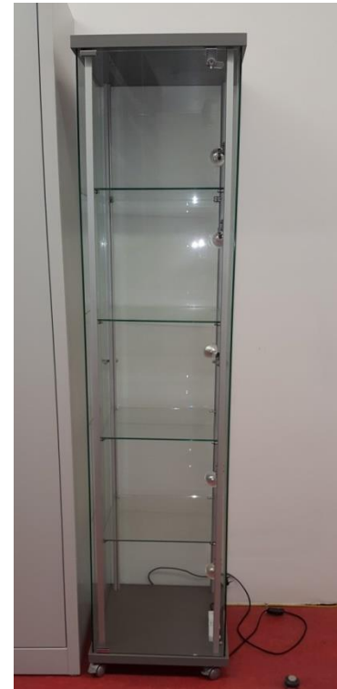
Quadratvitrine B 42,5 / T 42,5 / H180 cm Beleuchtung: 5 Strahler à 20 W Niedervolt